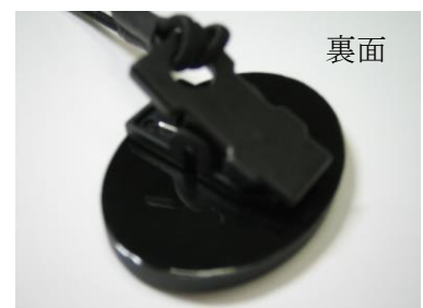
襟元に留めるクリップ付